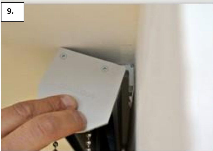
Strop - box nasadíte horní hranou na konzoly. Poznámka: box nejde nasadit – držáky nejsou v rovině