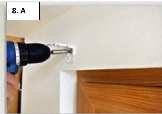
Další typ uchycení je uchycení konzoly na zeď.