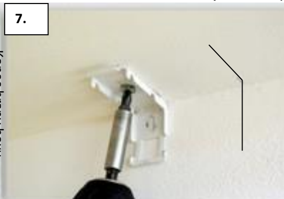
Uchycení konzoly na strop.