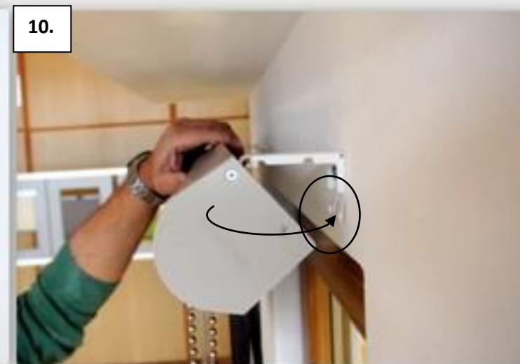
Zeď - docvakněte spodní hranu boxu na držáky.